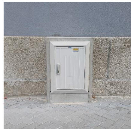
AD Tipo T