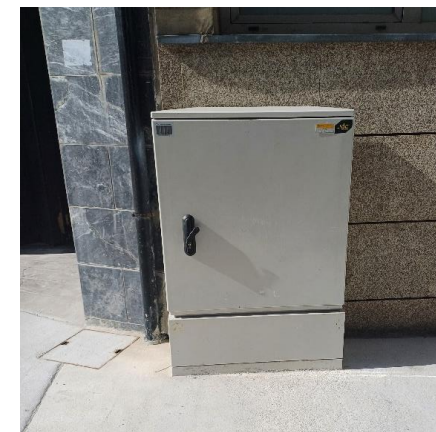
AD Tipo X