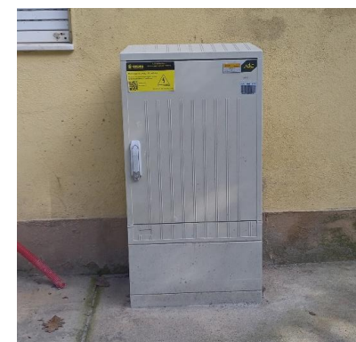
AD Tipo W